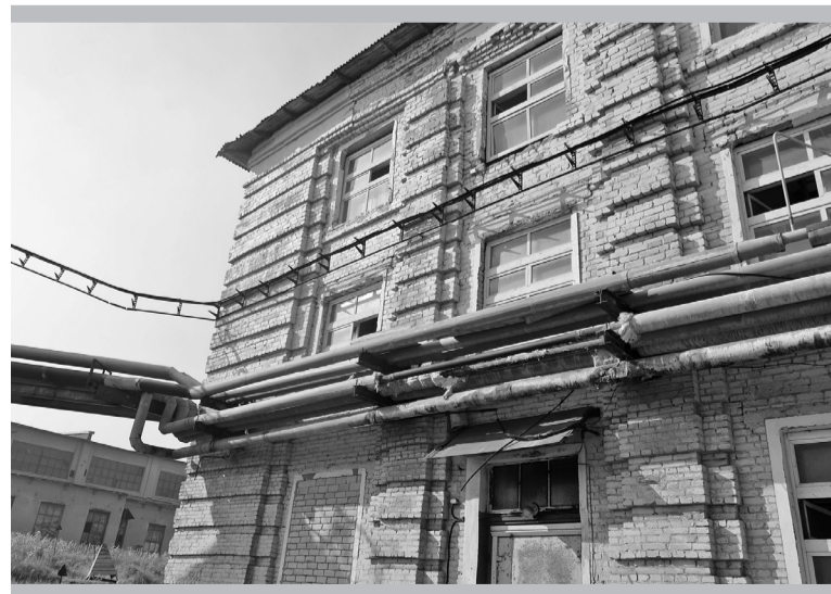
Восстановленный участок сетей у бытовых цеха № 1

Все подробности – в ближайших номерах газеты.